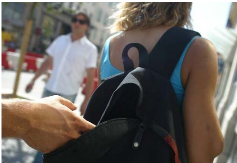
Les voleurs à la tire sont très habiles et ont particulièrement sévi cet été. d'illustration François Vignola