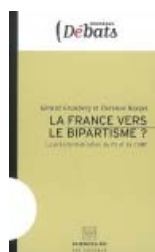
La France vers le bipartisme ? : la présidentialisation du PS et de l'UMP