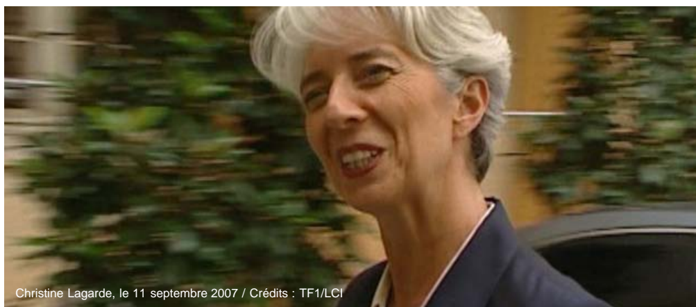
Christine Lagarde, le 11 septembre 2007

Mis en ligne le 04 novembre 2007 à 11h59, mis à jour le 04 novembre 2007 à 14h55