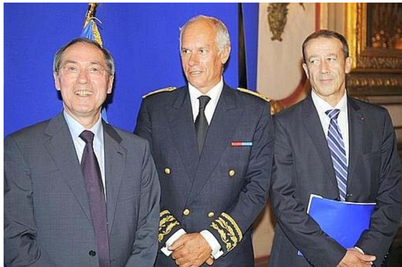
Le ministre de l'Intérieur, Claude Guéant, avant de prononcer un discours au côté du préfet de région Hugues Parant et du nouveau préfet délégué à la sécurité Alain Gardère.

Mis à jour le 29/08/2011 à 21:49 | publié le 29/08/2011 à 21:48 Réactions (47)